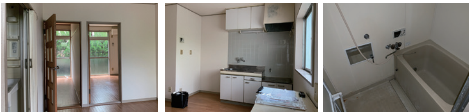
↑リノベーション前のお部屋